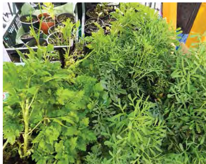
Sadike, pripravljene za 4. vseslovensko Zelemenjavo (14. 5. 2016), ki je potekala tudi na kmečki tržnici v Ajdovščini.