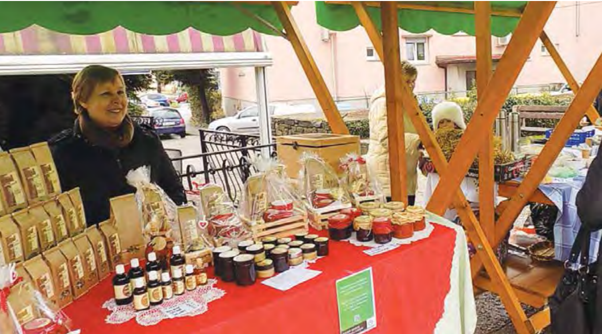
Na tržnici v Ajdovščini (februar in april 2016)