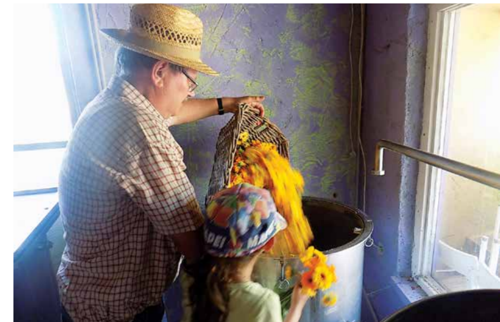
Destilacija ognjiča v Vili Lavanda (poletje 2016)

V senci (nam) je mama skrbno posušila nabrana zelišča. Takrat smo čutili, kot da mama za nas suši zelišča, saj bomo z denarjem kupili zvezke. Posušena smo ob sredah vozili na Col, kjer so jih odkupovali. Več kot smo jih nabrali, več denarja smo veseli prinesli domov. Spravila ga je mama, na jesen pred pričetkom šole pa smo šli skupaj nakupit šolske potrebščine.