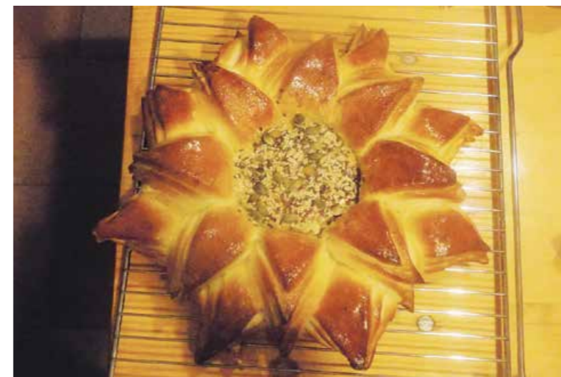
Alenkin kruh v obliki sončnice (januar 2016)

V posodo preseješ moko in narediš jamico, v katero zdrobiš kvas, posuješ ga s sladkorjem in preliješ z mlačnim mlekom ter pustiš nekaj časa, da kvas vzhaja. Ob strani daš žličko soli, dodaš olje in žvrkljana jajca. Malo jajc pusti za premaz. Zamesiš testo in narediš štruco. Na obeh koncih odrežeš in narediš hlebček, iz ostalega testa narediš še osem hlebčkov in pustiš vzhajati. Vzhajane hlebčke razvaljaš (enako velike), potem te plasti premažeš z oljem in po štiri postaviš eno plast na drugo. Vzameš pekač, ga postaviš narobe in nanj postaviš peki papir. Na papir damo štiri plasti in jih prerežemo (ne prav do konca), najprej na križ in potem še vsak trikotnik enkrat; vse trikotnike obrnemo navzven. Ko to naredimo, vsak list malo privzdignemo. Potem vzamemo druge štiri plasti in jih prerežemo do konca ter vsak trikotnik postavimo v notranjost. Na sredo postavimo deveti hlebček in ga potlačimo. Prav tako vsako plast pri trikotniku malo privzdignemo. Sončnico premažemo z jajcem, ki smo ga pustili, in sredino posujemo s semeni (lahko sezam, mak ali mešanica raznih semen). Sončnico damo v ogreto pečico (na 170 stopinj) in pečemo 30 min. Po potrebi tudi malo več; če preveč zarumeni, postavimo proti koncu nanjo peki papir.