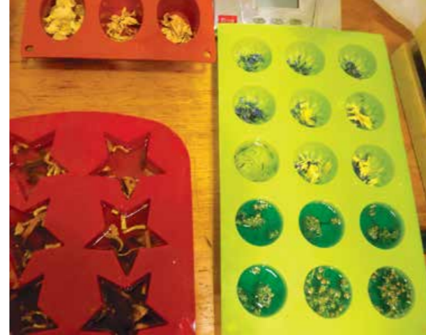
Glicerinska mila vlijemo v posebne kalupe, ki dajo milu obliko. Dodamo začimbe in zelišča za vonj.