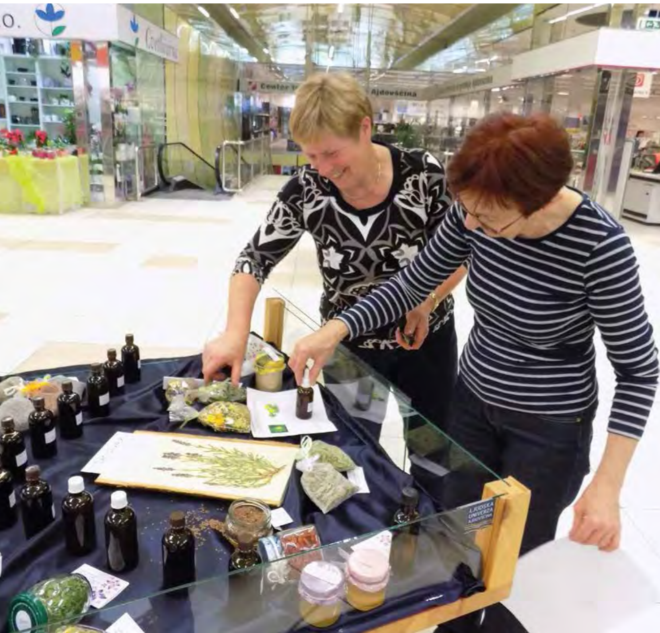
Udeleženci pripravljajo razstavo svojih izdelkov v MC v Ajdovščini (maj 2014)