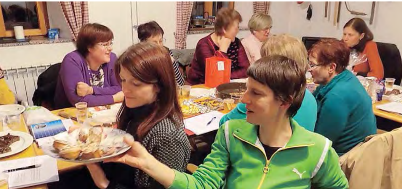
Vedno katera od članic prinese primere dobre hrane: posušene kakije, vložene dobrote, pecivo... Fotografiji sta nastali ob novoletnem obdarovanju (2015) in ob pogovoru o pripravi (turškega) bureka. Članice in člani vedno skrbijo za dobro klimo v skupini, zato so pomembna občasna (praznična) obdarovanja in pogostitve.