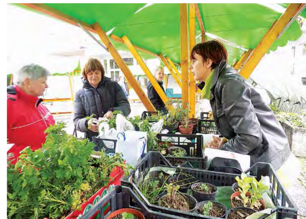
ZELEMENJAVA V APRILU IN MAJU 2016: MENJAVA SADIK V APRILU so podarjali in zamenjevali sadike.