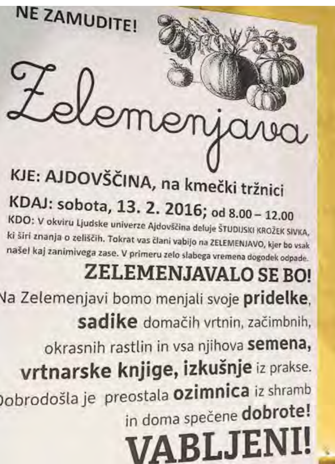
Priprava semen za zelemenjavo in plakat z vabilom (februar 2016)