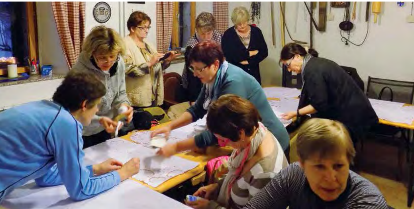
Pri vezeninah (v župnišču v Podragi 2015) in pri računalnikih (na LU Ajdovščina 2015)