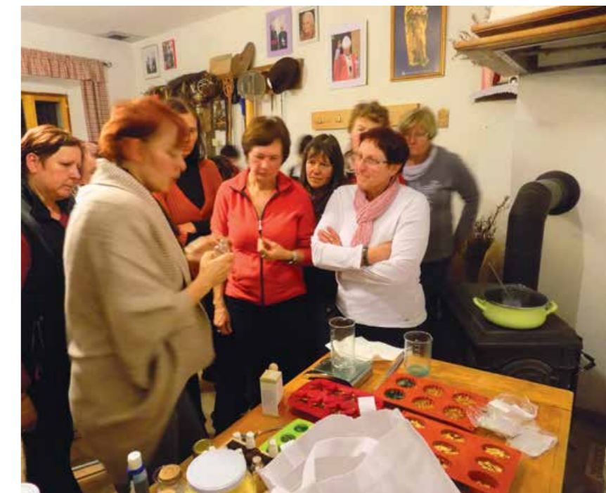
Delavnice o izdelavi glicerinskega mila in balzamov za ustnice (2015). Na fotografiji je vidna peč, ki jo pozimi zakurijo, da je prostor topel.

»Med članicami krožka sem našla vse to in še več. Naša srečanja v zadnjem času segajo na področje naravnega vrtnarjenja , pred tem pa smo se učile izdelovanja naravne kozmetike, spoznavale smo zelišča in njihovo uporabnost v zdravilne namene, pa tudi v kuhinji in nasploh v gospodinjstvu. Veliko smo se naučile od naše mentorice, pa tudi druga od druge, saj so nekatere članice prava zakladnica znanja. Od mojega prvega srečanja pri krožku so minila tri leta, pa se jih vedno znova veselim. Vsako novo srečanje prinese novo znanje, ki mi olajša delo na vrtu, kakor tudi pri kuhanju in ostalih gospodinjskih opravilih.«