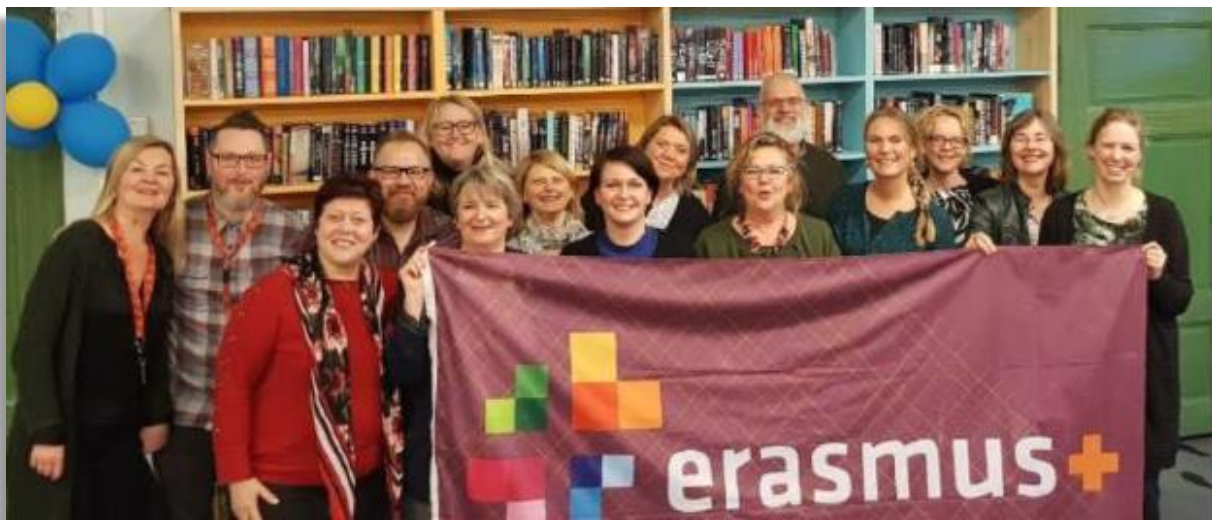
Figuur 1 De deelnemers aan het werkbezoek met de Noorse hosts.

Kort samengevat: AFT is een plan (het wat), dan een match (het waar en hoe), en met support (ondersteuning in de vorm van een plan).