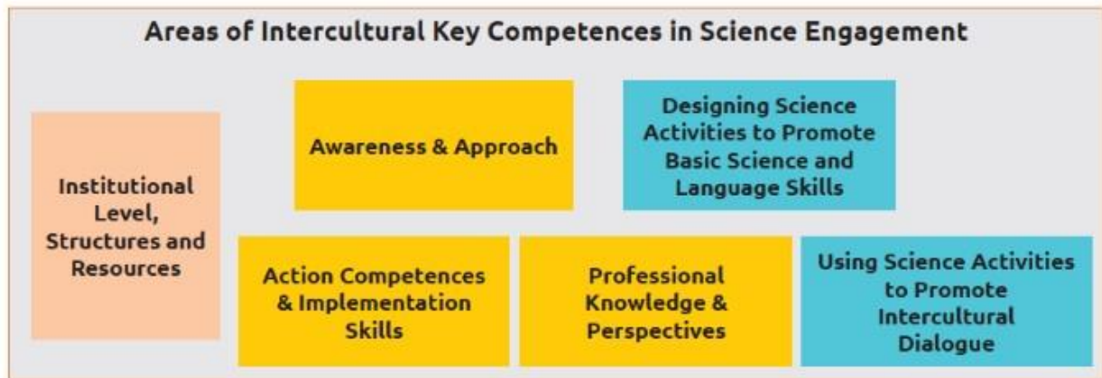
Figur 1 Områden för interkulturella nyckelkompetenser