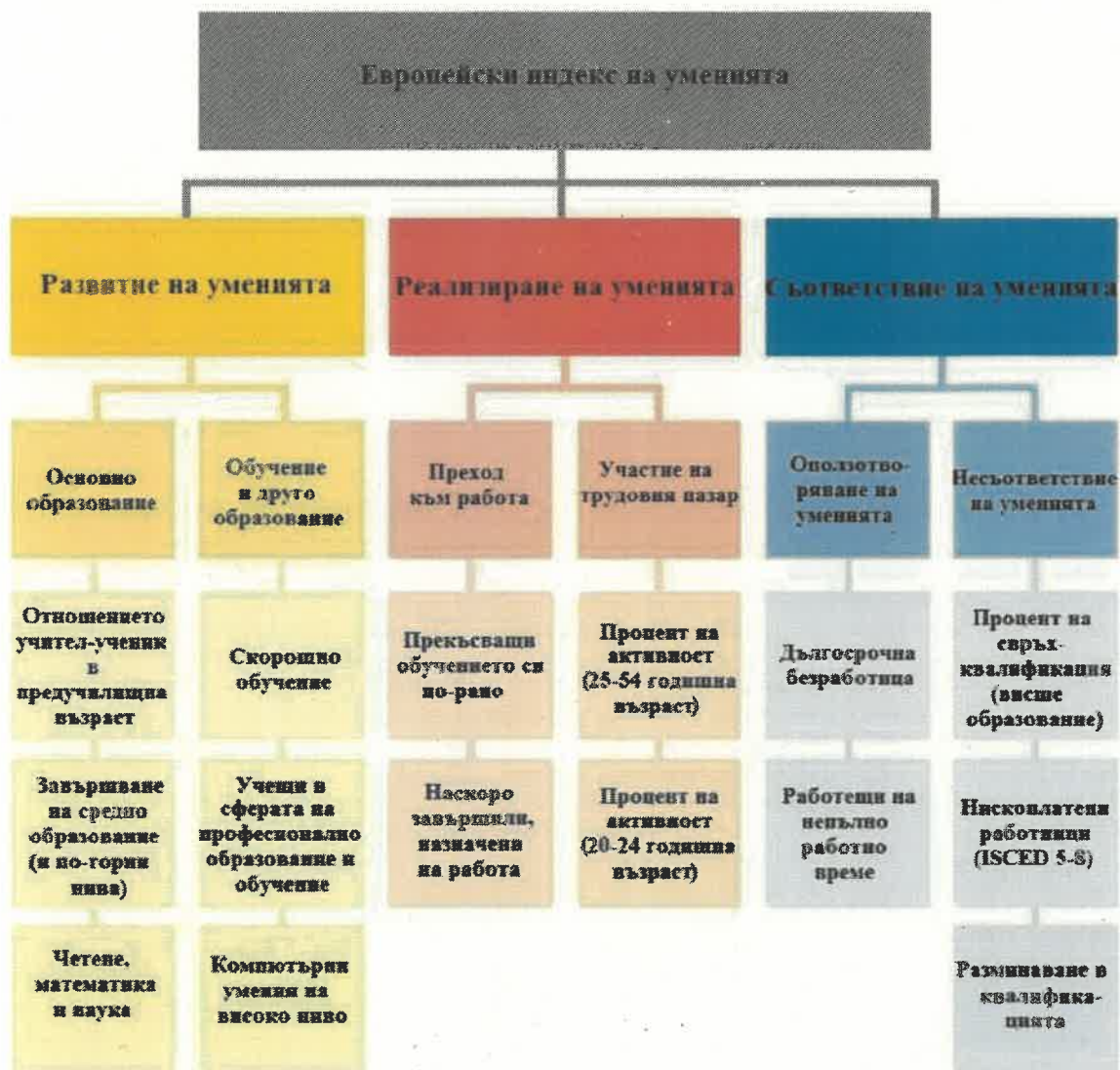
Фигура 2. Структура на Европейския индекс на уменията.

и 15 показателя в добре балансирана структура със статистическа методология, осигуряваща равен принос на всяко подразделение към общия индекс.